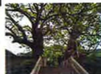
境内の被爆クスノキ